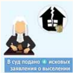
В суд подано 4 исковых заявления о выселении

С начала 2018 года сотрудниками КРКЦ было подано в Королёвский городской суд 4 исковых заявления о выселении. Эта мера воздействия на неплательщиков ЖКУ определена ст. 83, 90 ЖК РФ, п. 38 ППВС РФ от 02.07.2009 №14 «О некоторых вопросах, возникших в судебной практике при применении Жилищного кодекса РФ». Выселение – крайняя и нежелательная мера, которая рассматривается судом в индивидуальном порядке.