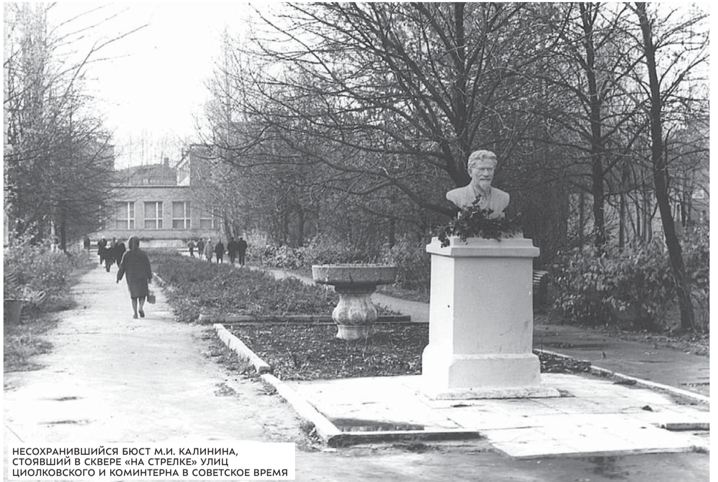
НЕСОХРАНИВШИЙСЯ БЮСТ М.И. КАЛИНИНА, СТОЯВШИЙ В СКВЕРЕ «НА СТРЕЛКЕ» УЛИЦ ЦИОЛКОВСКОГО И КОМИНТЕРНА В СОВЕТСКОЕ ВРЕМЯ

Это по-своему красивое допущение, однако не выдерживает критики. Во-первых, непонятно, почему начальный звук «В» сменился на «Б». Во-вторых, в документах (в тех же писцовых книгах XVI в., например) форма «Болошево» отсутствует. И в третьих, впервые село Болшево появляется на бумажных страницах – в писцовой книге за 1573–1574 гг. – в виде «Болшово». А это гораздо ближе к слову «боль-