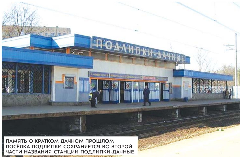
ПАМЯТЬ О КРАТКОМ ДАЧНОМ ПРОШЛОМ ПОСЁЛКА ПОДЛИПКИ СОХРАНЯЕТСЯ ВО ВТОРОЙ ЧАСТИ НАЗВАНИЯ СТАНЦИИ ПОДЛИПКИ-ДАЧНЫЕ