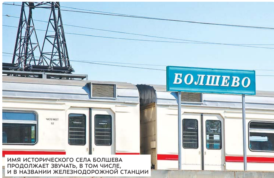
ИМЯ ИСТОРИЧЕСКОГО СЕЛА БОЛШЕВА ПРОДОЛЖАЕТ ЗВУЧАТЬ, В ТОМ ЧИСЛЕ, И В НАЗВАНИИ ЖЕЛЕЗНОДОРОЖНОЙ СТАНЦИИ