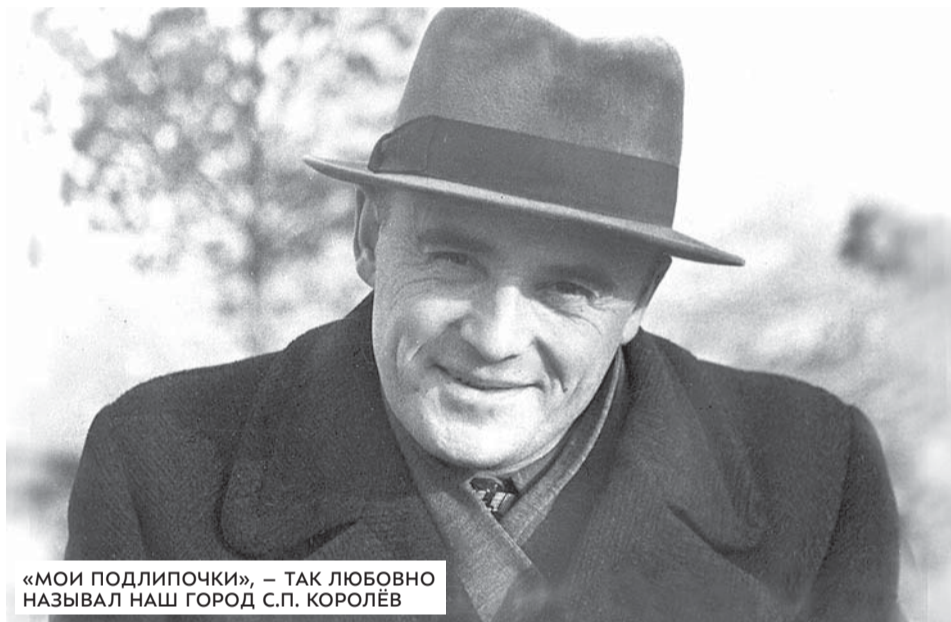
«МОИ ПОДЛИПОЧКИ», – ТАК ЛЮБОВНО НАЗЫВАЛ НАШ ГОРОД С.П. КОРОЛЁВ